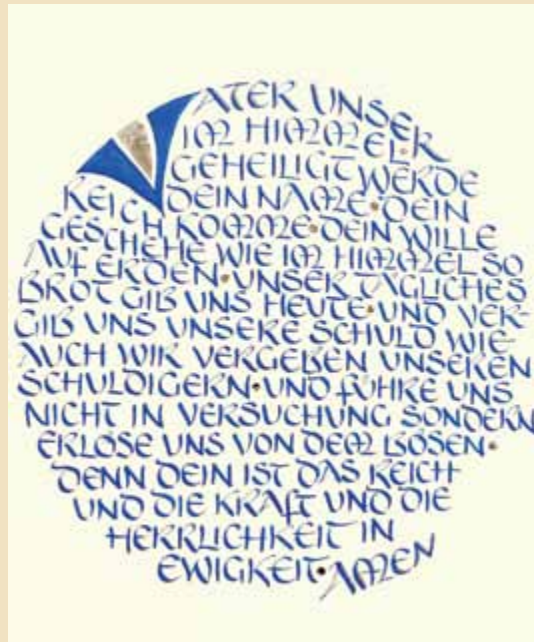
Kalligraphie: Elli Konstanzer

Gottesdienst in der Reihe von 17 Gottesdiensten zum Reformationsjubiläum 2017 in der Oldenburger Kirche.