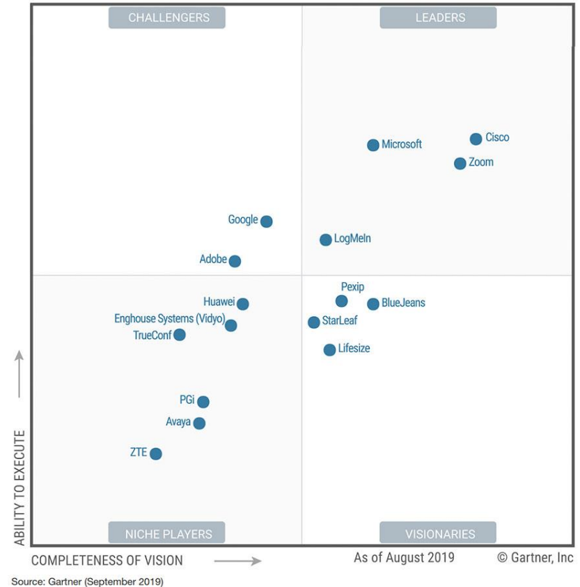
Figure 1. Magic Quadrant for Meeting Solutions